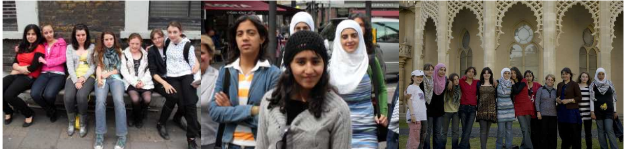
"Buddies" during the youth visit from Abu Dis to Camden, June 2008.

This is going to as many teachers as we can send it to in Camden and Abu Dis. Please show this to your friends and colleagues.